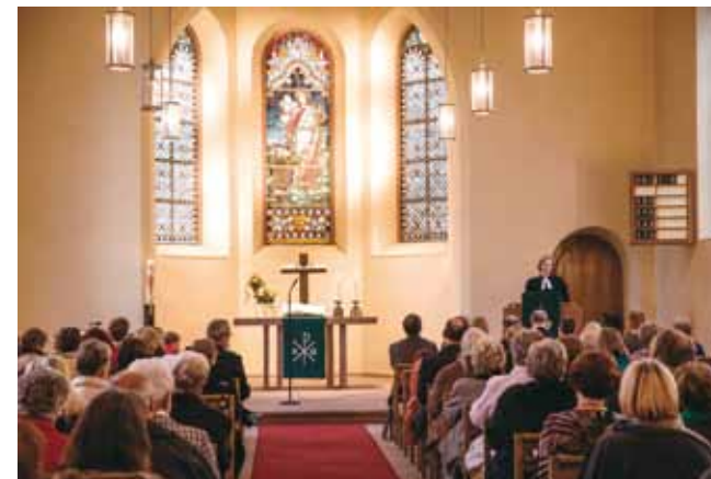
Gottesdienst in der Petruskirche

Das Jahr 2019 – was wird es bringen? Als Gemeinde gehen wir recht gelassen mit dieser Frage um, denn wir denken ja von der Ewigkeit her. Für uns ist 2019 das wichtig, was immer wichtig ist: